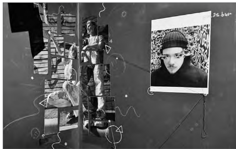
Итоговая экспозиция DAKC (Немецкая академия искусств в Челябинске)