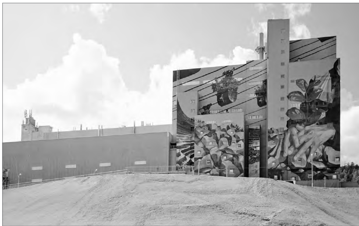
Мурал «Рекультивация» Андрея Оленева на фасаде здания высокотемпературных шахтных печей Группы «Магнит»

Всего в рамках шестой Уральской индустриальной биеннале арт-резиденций было девять. На самом деле инициативные группы не обращались к художникам напрямую, они формулировали свои намере-